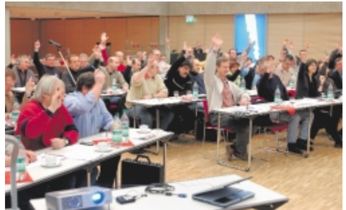
Mehrheitlich hat die Stahl-Tarifkommission für NRW, Niedersachsen und Bremen am 16. Februar im IG Metall-Bildungszentrum Sprockhövel die Forderung für die Stahl-Tarifrunde 2005 beschlossen.

„Ich halte unsere Forderung für voll und ganz berechtigt. Aus gesamtwirtschaftlicher Sicht