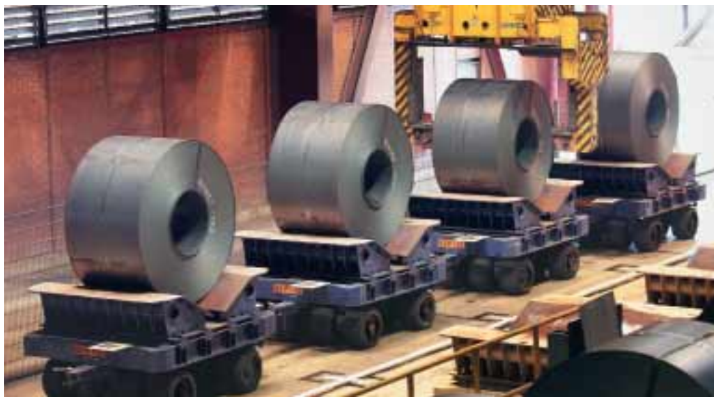
Das Geschäft brummt: Die IG Metall fordert 6,5 Prozent mehr Lohn und Gehalt.

Die Spatzen pfeifen es von allen Dächern: Die Stahlindustrie boomt. Ihr geht's richtig gut. Die Produktion läuft auf Hochtouren, die Unternehmen fahren traumhafte Gewinne ein. Trotzdem geben die Stahl-Arbeitgeber das nicht zu. Stattdessen drehen und winden sie sich. Anderthalb Stunden diskutieren der Arbeitgeberverband Stahl und die IG Metall in der ersten Tarifverhandlung am 17. März in Gelsenkirchen die wirtschaftliche Situation der Branche. Sie trennen und vertragen sich ohne Annäherung. Zwischen den Tarifparteien liegen Welten.