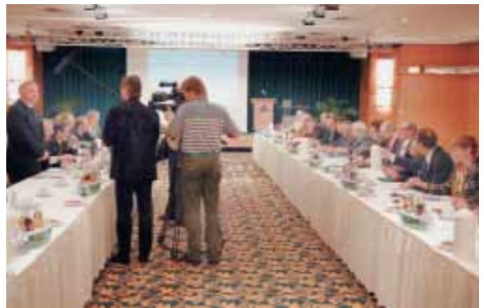
17. März, Gelsenkirchen, kurz vor Beginn der ersten Tarifverhandlung für die Stahlindustrie von Nordrhein-Westfalen, Niedersachsen und Bremen: An langen Tischreihen sitzen sich IG Metall (rechts) und Stahl-Manager gegenüber. Noch ist Presse zugelassen.

„Die Stahl-Arbeitgeber erwecken den Eindruck, als wären wir im Bauhauptgewerbe: Sie mauern sehr stark. Hoffentlich zeigen sie sich mit der Zeit einsichtiger. Sonst müssten wir ihr Verhalten jetzt schon als Aufforderung zum Tanz verstehen – und diese Aufforderung sollten wir dann auch annehmen. Alle Vorstandsmitglieder kennen doch ihre Ergebnisse. Trotzdem stöhnen sie, allerdings auf einem sehr hohen Niveau. Das nehme ich allerdings ernst; hoffe aber, dass es nicht dabei bleibt.“